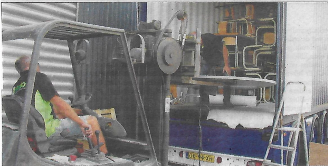
Het meubilair is bestemd voor het Radulphus College, de Johan van Walbeecschool, het Coromoto College en basisschool Glorieux.